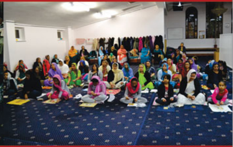
શ્રી શિક્ષાપત્રી પૂજન - ઓલ્ડહામ (યુ.કે.)