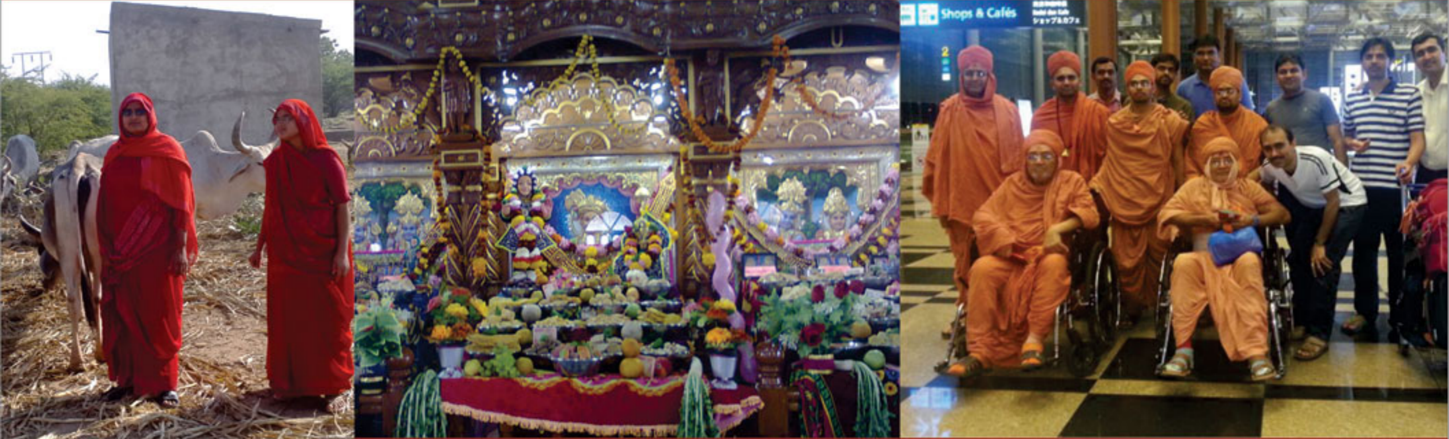
સુખપર નરનારાયણનગરમાં સંકાંતીના દિવસે અમ્નકૂટ ઉત્સવ તથા સાં. યો. બાઈઓ દ્વારા ગાયને ચારો