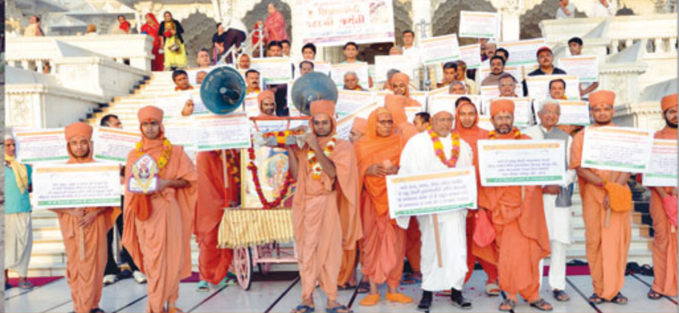
શ્રી શિક્ષાપત્રીની ૧૮૮મી જયંતી પર્વે શિક્ષાપત્રી પૂજન, તથા શિક્ષાપત્રી શોભાયાત્રા-ભુજ