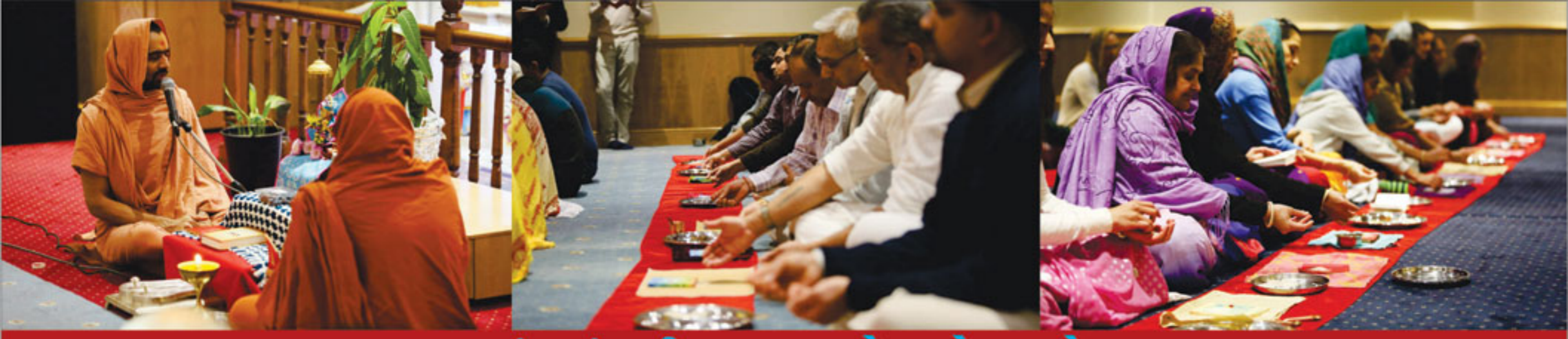
વસંત પંચમી પૂજન - સ્ટેનમોર યુ.કે.