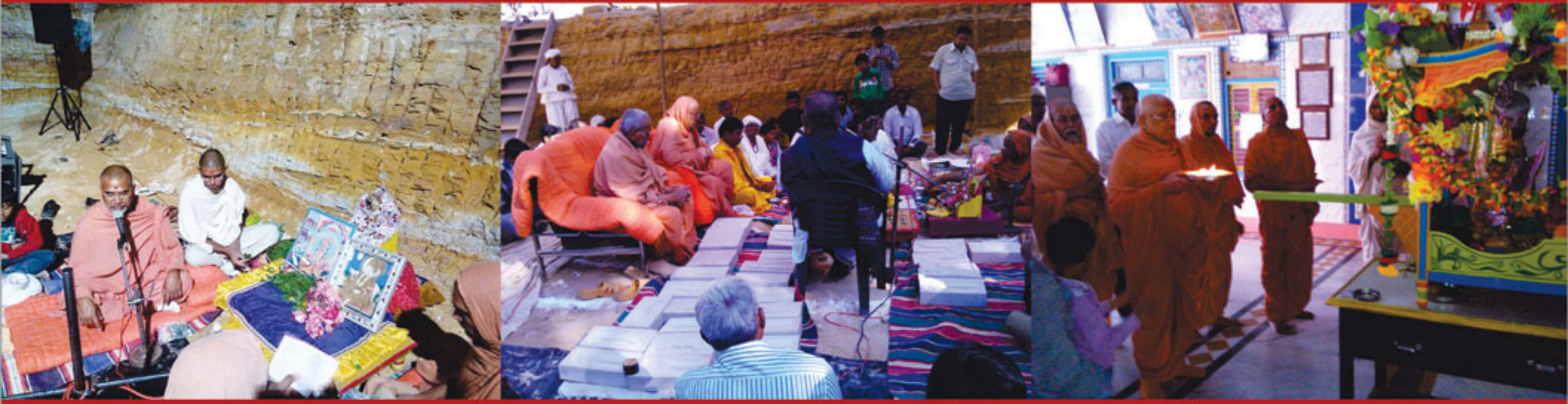
રાપર નૂતન શ્રી સ્વામિનારાયણ મંદિરનો શિલાન્યાસ વિધિ સાથે શ્રી શિક્ષાપત્રી પૂજન પ.પૂ. મહંત સ્વામીના સાનિધ્યમાં સંપન્ન થયું. રાપર