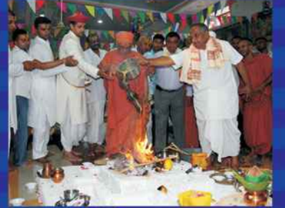
હવનકુંડમાં ઘી હોમતા પ.પૂ. મહારાજશ્રી તથા મહંત સ્વામી