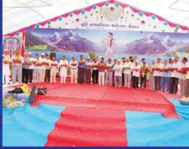
પોથીચાત્રામાં જોડાયેલ ભાઈઓ