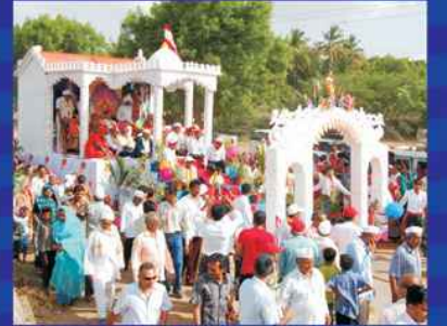
શોભાયાત્રામાં ઉપસ્થિત પ.પૂ. મહારાજશ્રી