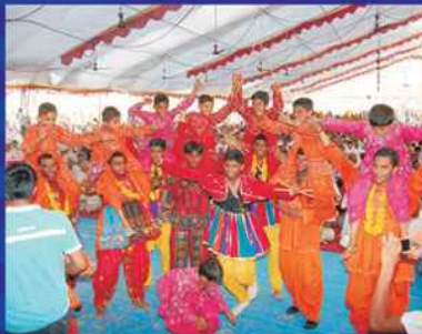
શ્રી ઘનશ્યામ મહોત્સવમાં દિલ દર્દને રાસલીલા કરતા યુવાનો