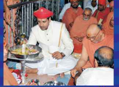
અભિષેક કરતા પ.પૂ. મહારાજશ્રી