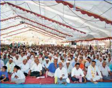
વિશાળ ભક્ત સમૂદાય