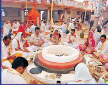
વિષ્ણુયાગ કરતા હરિભક્તો