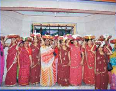
પોથીચાત્રામાં જોડાયેલ બહેનો