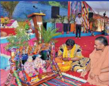
શ્રી ઘનશ્યામ મહોત્સવ