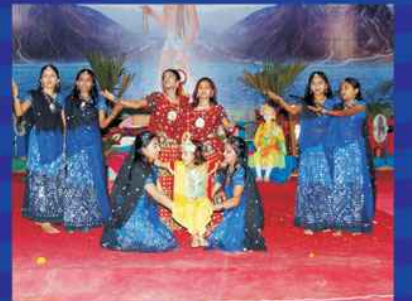
રાત્રી સાંસ્કૃતિક કાર્યક્રમ