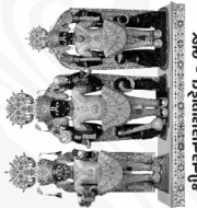
શ્રીનંદનારાયણદેવ - ભુજ