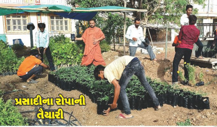
પ્રસાદીના રોપાની તેચારી