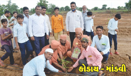
કોડાય - માંડવી